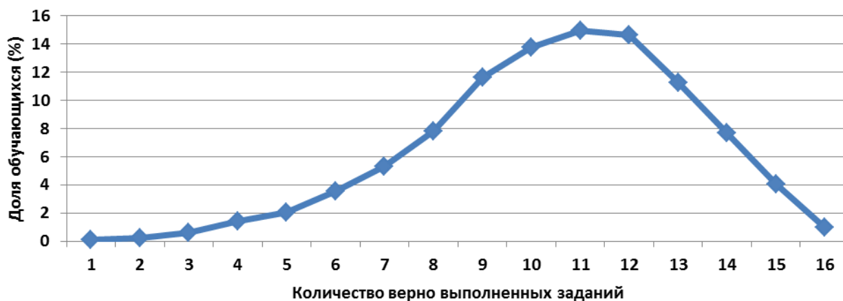
Распределение обучающихся по количеству верно выполненных заданий

По результатам мониторинга обучающиеся в среднем выполняли верно 10 заданий.